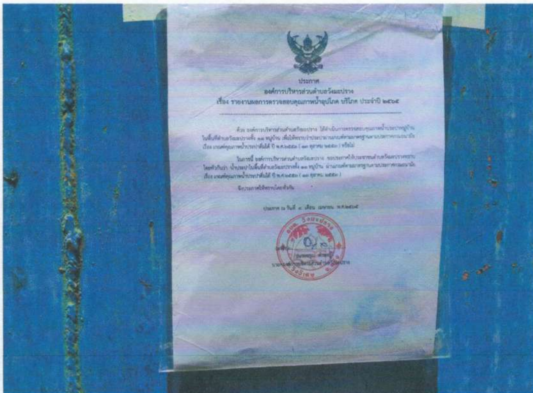
ระบบประปาหมู่บ้านกลาง หมู่ที่ ๑๑