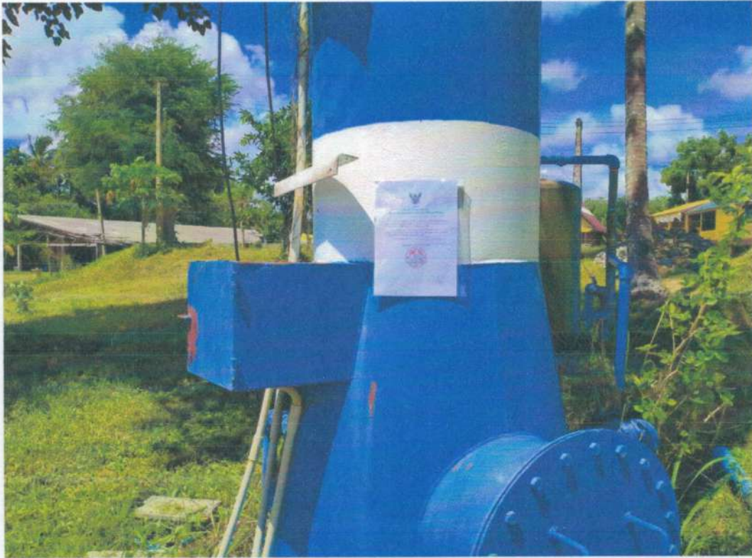
ระบบประปาหมู่บ้านบางลึก หมู่ที่ ๕