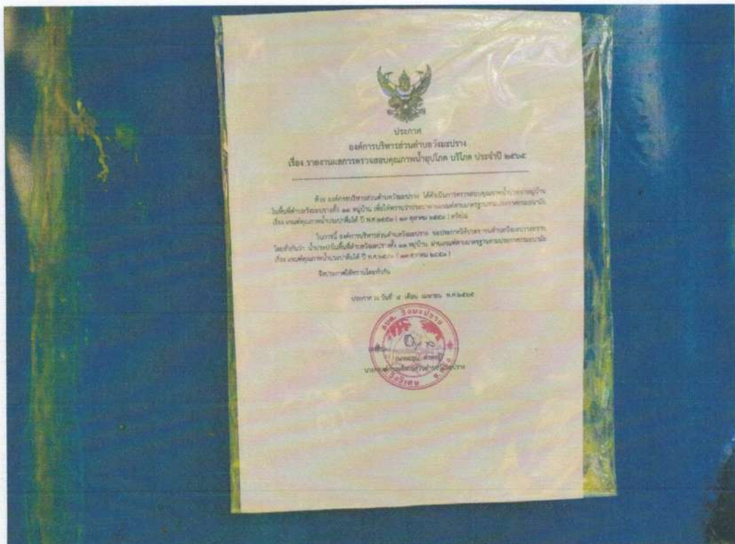
ระบบประปาหมู่บ้านทุ่งสำน หมู่ที่ ๙