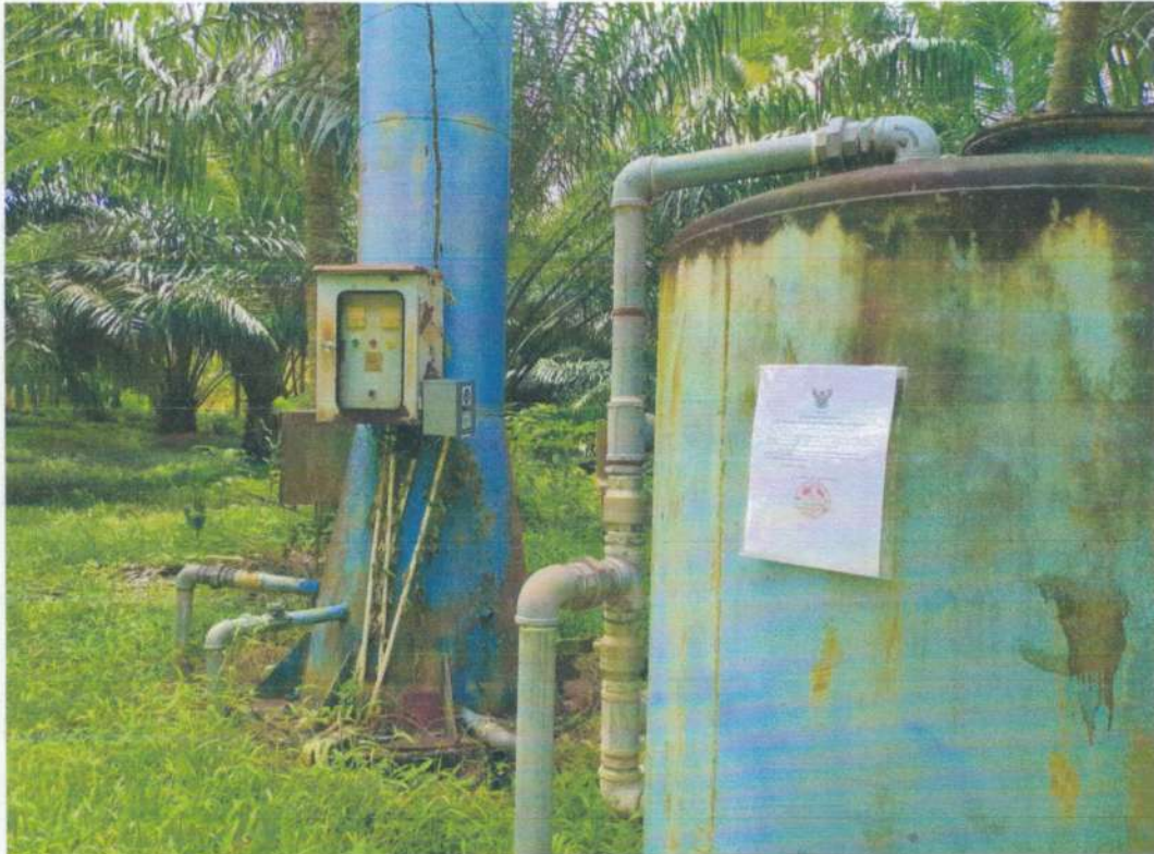
ระบบประปาหมู่บ้านวังใหม่ หมู่ที่ ๘