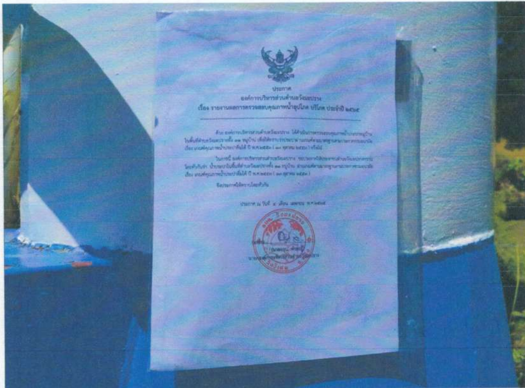
ระบบประปาหมู่บ้านบางลึก หมู่ที่ ๕