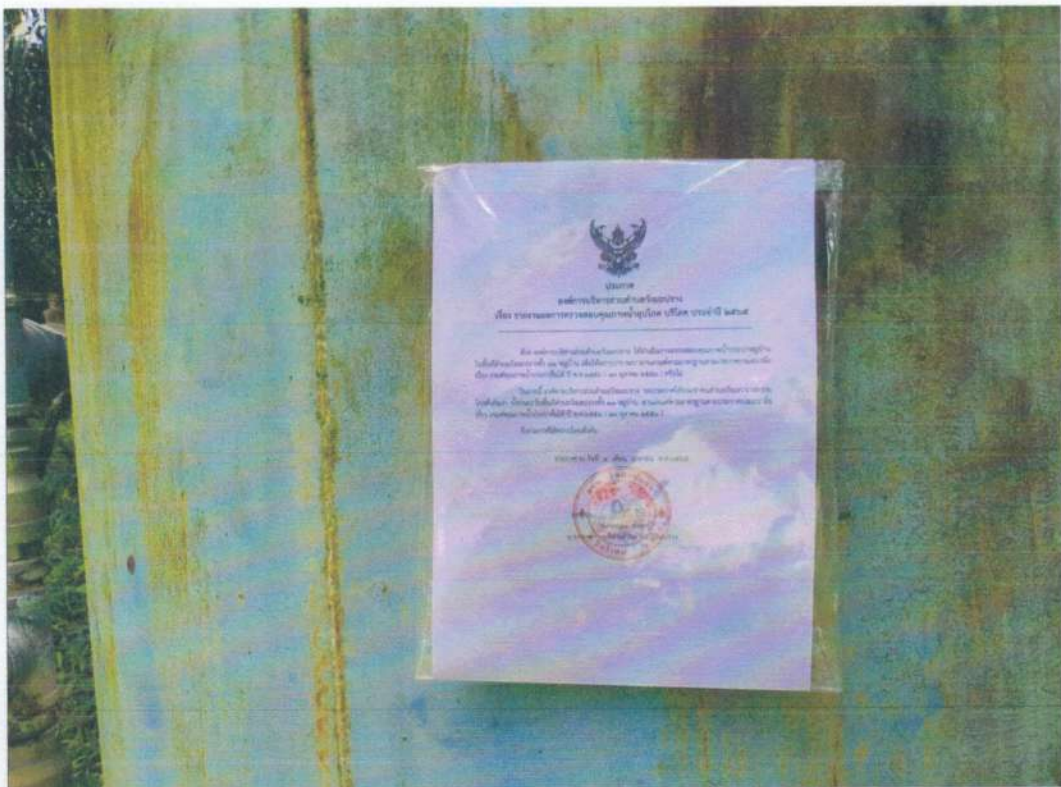
ระบบประปาหมู่บ้านวังใหม่ หมู่ที่ ๘