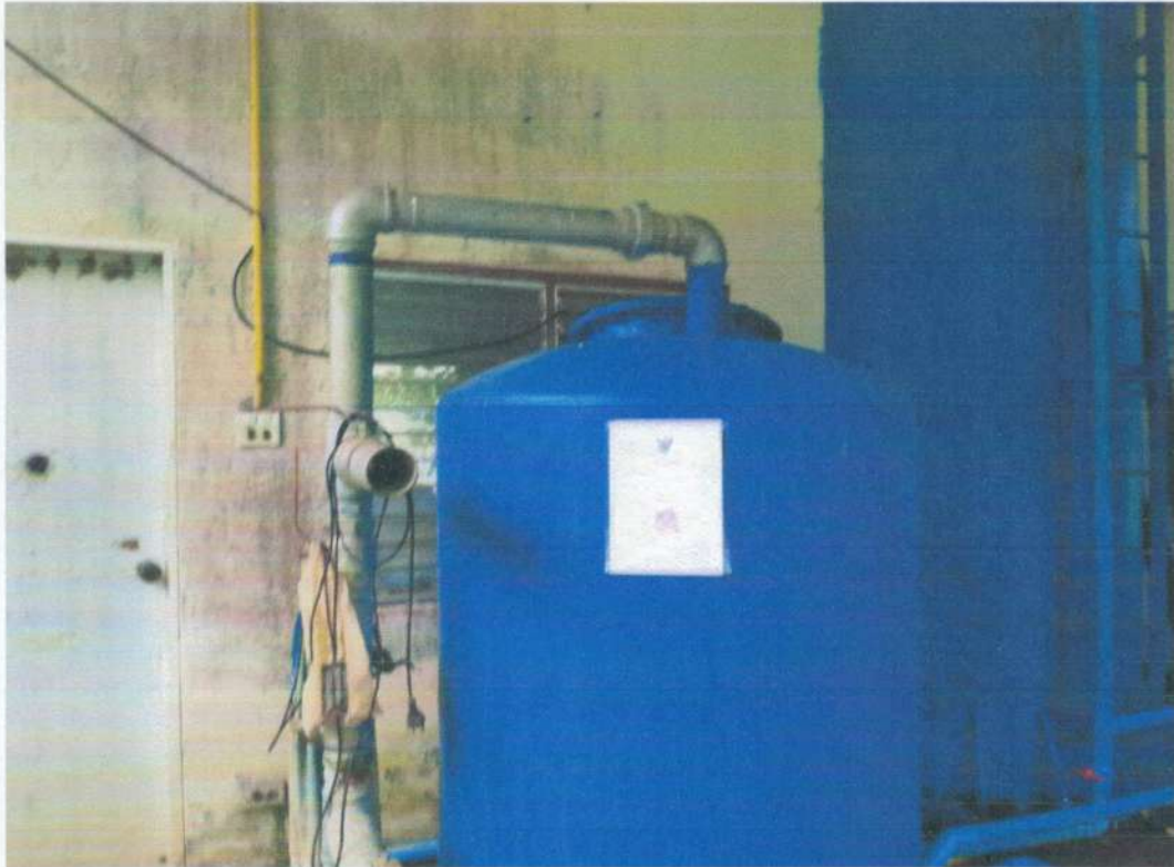
ระบบประปาหมู่บ้านโคกพลา หมู่ที่ ๔