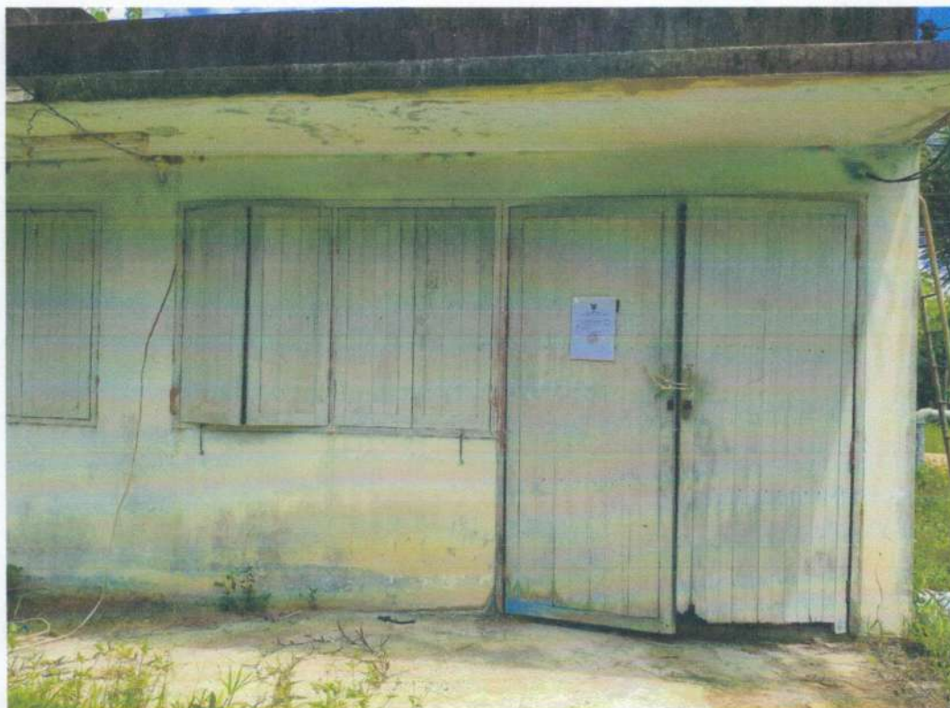
ระบบประปาหมู่บ้านทุ่งหลวง หมู่ที่ ๗