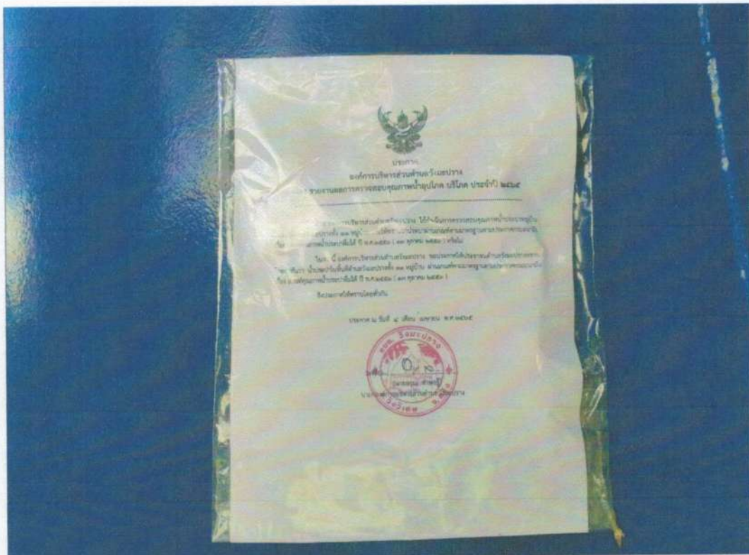
ระบบประปาหมู่บ้านน้ำฉ่ำ หมู่ที่ ๒