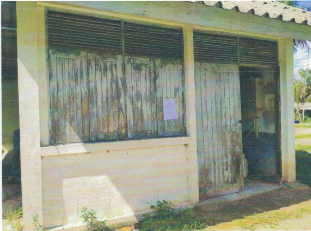
ระบบประปาหมู่บ้านบางสมบูรณ์ หมู่ที่ ๑๐