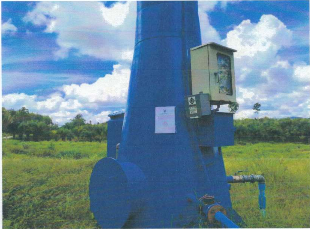
ระบบประปาหมู่บ้านบางพระ หมู่ที่ ๓