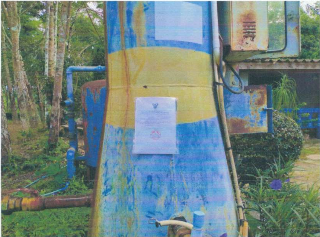
ระบบประปาหมู่บ้านช่องลม หมู่ที่ ๖