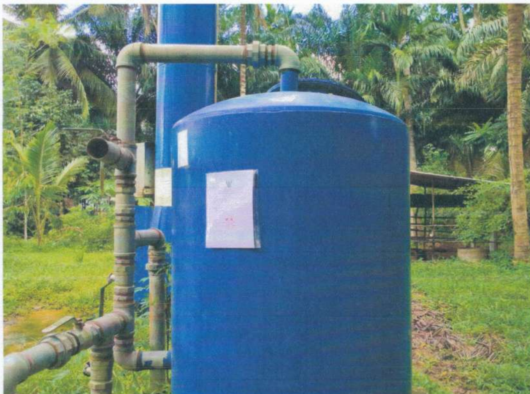
ระบบประปาหมู่บ้านบางนา หมู่ที่ ๑