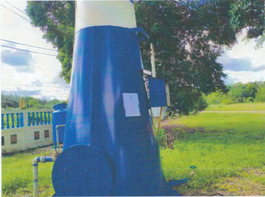
ระบบประปาหมู่บ้านน้ำฉ่ำ หมู่ที่ ๒