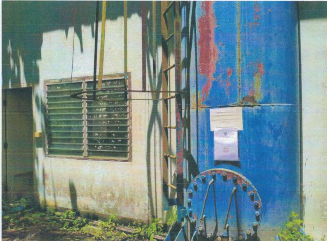
ระบบประปาหมู่บ้านกลาง หมู่ที่ ๑๑