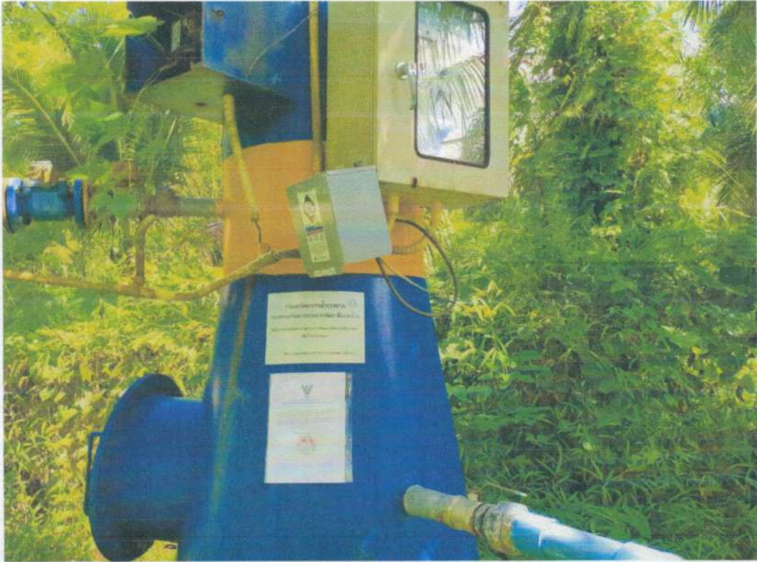
ระบบประปาหมู่บ้านทุ่งสำน หมู่ที่ ๙